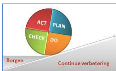
Figuur 1: PDCA cyclus